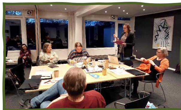
TR-kursus 2024 i Odsherred Lærerkreds

Vi holder i løbet af året ca. 1 TR-møde om måneden og afholder også to dages TR-kursus for at videreudanne vores TR-gruppe. I januar afholdt vi dette års TR-kursus, hvor vi bl.a. med oplæg fra to konsulenter fra foreningen arbejdede med at kvalificere TRs rolle i forhold til arbejdet lokalt med forhandling og med skoleplanen. Derudover holder vi to fælles TR/AMR-møder om året og 3 årlige møder alene for alle AMR. Det er