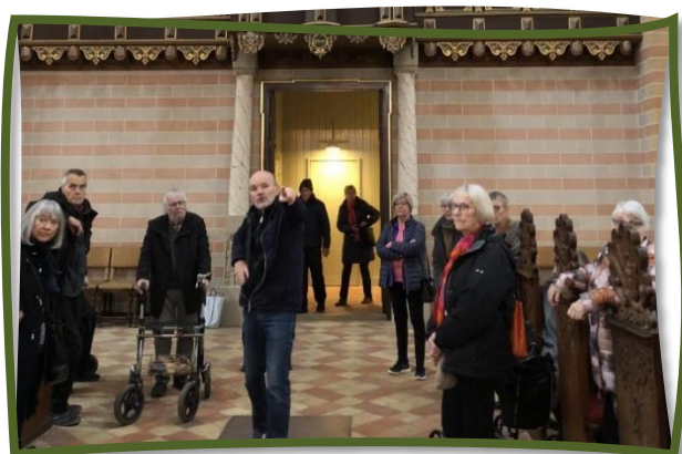
Fraktion 4 i Sorø

Kør-selv-turen i oktober gik til den nyrestaurerede klosterkirke i Sorø samt Sorø Akademi. Også her nød vi at lytte til den meget kompetente guide og få indblik i såvel skolens som kirkens historie. Efterfølgende spiste vi en let frokost på Sorø Station.